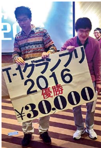
昨年度の『T-1グランプリ2016』の優勝者は、この日初めて漫才を披露したという筑波大生コンビ「いかにダグラッシューズ」さんでした。

一度、お笑いをしてみたい人の大会への参加はもちろんのこと、運営スタッフも随時、募集しております。ぜひ、我々と一緒に、つくば市を、いや全国を盛り上げていきましょう。